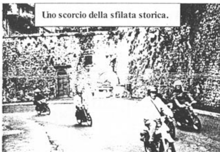
Uno scorcio della sfilata storica.