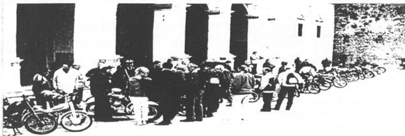
Un momento di sosta dei partecipanti davanti al duomo.